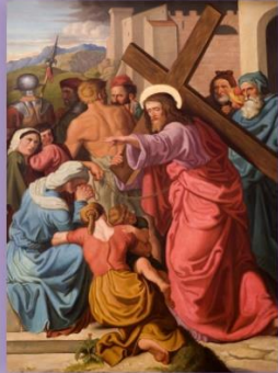
Stacja VIII Pan Jezus pociesza płaczące niewiasty