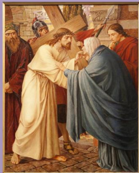
Stacja IV Pan Jezus spotyka Matkę bolesną