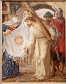
Stacja VI Św. Weronika ociera twarz Panu Jezusowi