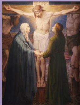
Stacja XII Pan Jezus na krzyżu umiera